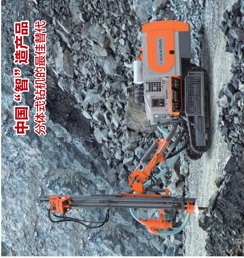
对德掘进（上海）国际贸易有限公司保留最终解释权